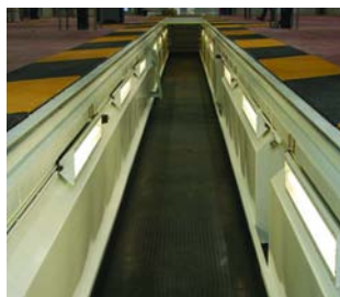
Fosses de travail/maintenance

À ce jour, nous avons construit et posé environ 3000 fosses préfabriquées pour un large éventail de clients. Ceci nous a permis d'élaborer la FORMULE PREMIER PITS exclusive, qui intègre tout, du concept initial jusqu'à la mise en service.