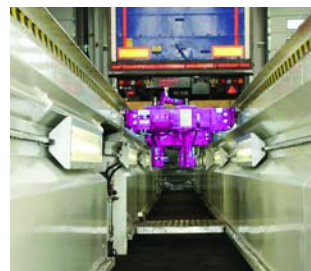
Fosses de visite