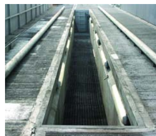
Fosse de lavage