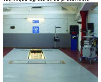
Fosse ATL (banc de contrôle technique automatisé) classe 4 VL et utilitaires jusqu'à 3 t)