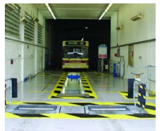
Fosses pour centres de contrôle technique agréés et de précontrôle